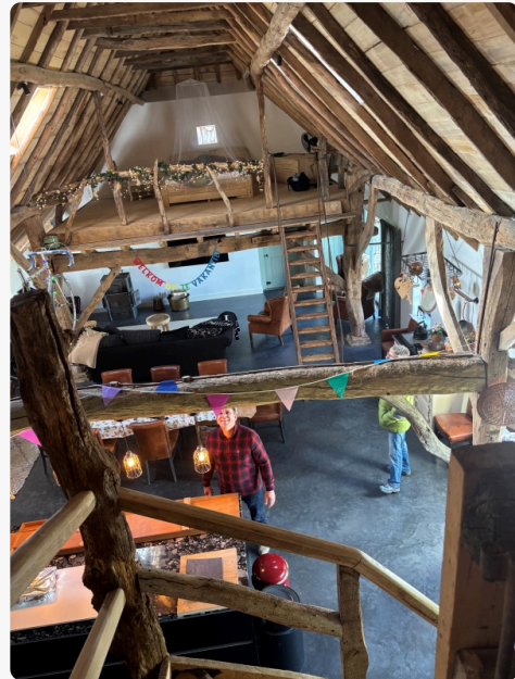
Hier wird ganz genau das Gebäck begutachtet: Dieser Hof wurde 1740 erbaut und 2025 zu einer Kurzzeitpflege umfunktioniert. Ein ganz besonderer Ort!