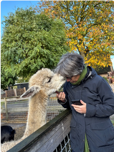
Ein inniger Moment zwischen einer Teilnehmerin und einem Alpaka beim Besuch eines Pflegehofes im Oktober diesen Jahres.

Immer wieder erreichen uns Anfragen von Interessierten, die „Pflegehöfe live“ erleben möchten. Weil unser eigener Pflegehof noch in der Entstehung ist, unternehmen wir regelmäßig Bildungsreisen in die Niederlande. Dort besuchen wir verschiedenste inspirierende Pflegehöfe, von ehemaligen landwirtschaftlichen Betrieben die Gebäude umgenutzt haben bis zu neugebauten Pflegehöfen, die ihre Vision gezielt in Architektur widergespiegelt haben. Vor Ort sprechen wir mit den Manager:innen über ihre Sicht auf gutes Leben mit Demenz, Behinderung oder psychischen Erkrankungen, erleben den Alltag auf den Höfen, schauen uns ganz genau Architektur, Gärten und Gemeinschaftsräume an - und spüren, wie durchdachtes Umfeld, Nähe zur Natur und ein wertschätzendes Miteinander die Lebensqualität der Bewohner:innen prägen. Auch im nächsten Jahr planen wir wieder Reisen – wer Interesse hat, mitzukommen, darf sich gerne bei uns melden.